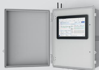
GrowSphere™ MAX דלת כפולה עם מסך