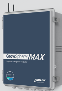
GrowSphere™ MAX ללא מסך