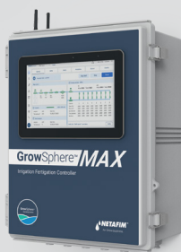
GrowSphere™ MAX עם מסך